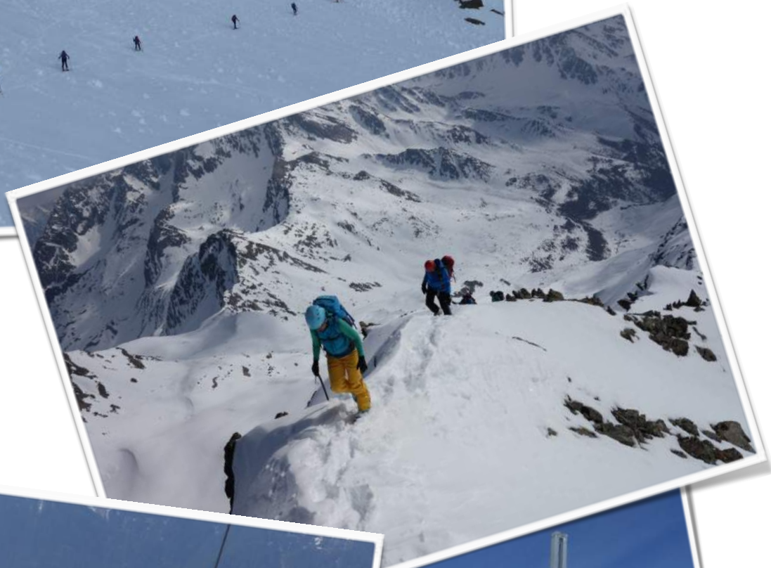
Blick ins Ötztal