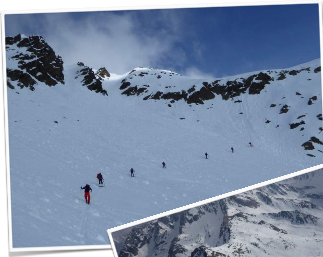
Das letzte Stück zum Gipfel