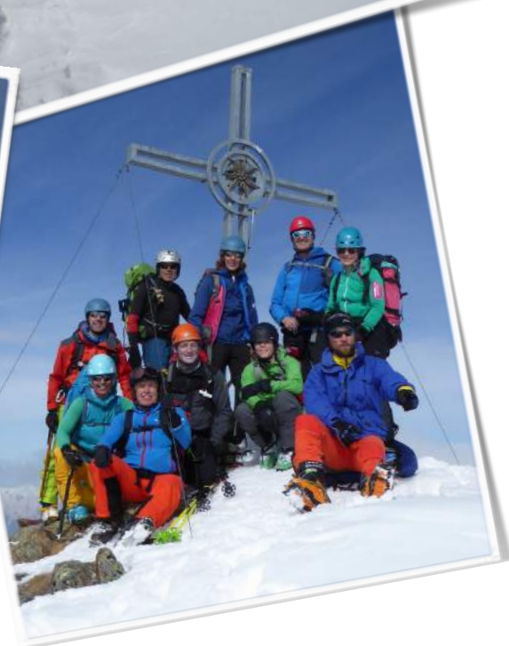
Tourenbericht, Seite 4